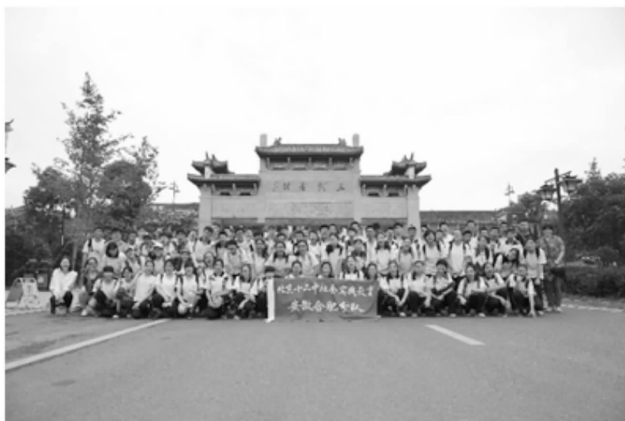
同学们在拙政园门前合影

踏入园中，典型的苏州园林这一建筑瑰宝便将自己的魅力发挥得一览无余。屋顶的四角高高的翘起，似大鹏展翅般直插云霄，那古典的，富集先人智慧的拱形建筑构造也令同学们啧啧称奇。最有意境的当属似剪花般的窗户。与北方的厚重不同，江南建