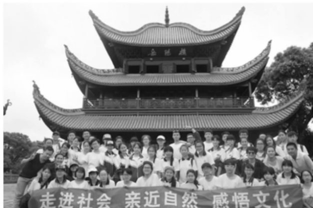
湖南分队参观岳阳楼

炎炎夏日，我们来到星海广场——一个现代与传统文化结合的地方。南边的百年城雕是一本翻开的书，寓意深刻。城雕前，一千双脚印揭示了大连一步一个脚印地走过了百年。在城雕上踱步，眼前不尽的大海奔流不息，让人期待大连日后的发展。