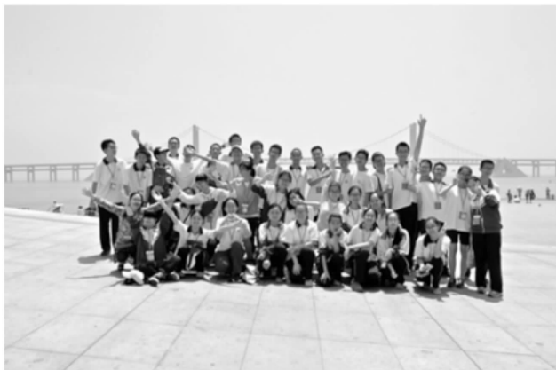
辽宁大连分队高一(4)班参观劳动公园合影