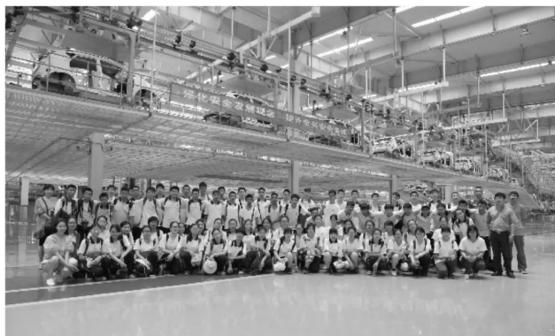
参观江淮汽车制造厂总装车间

11:00,一行人来到位于合肥市近郊的江淮汽车制造厂,参观总装车间。车间内干净、整洁,工作区与休息区相邻,供工人读书、下棋等。汽车装配过程自动化程度高,安全高效。同学们在这里第一次与汽车生产过程零距离接触,看到当今国产汽车的发展现状,对自主品牌振兴民族汽车工业充满信心。