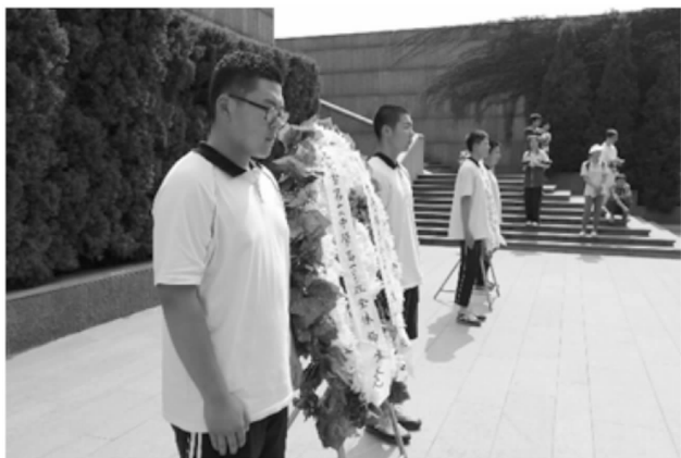
北京十二中学生为南京大屠杀遇难者敬献花圈

告别了夫子庙,我们结束了五天的京外社会实践之旅,我们品味了文化,知晓了历史,更给自己明确了前进的方向。我们还在民族前进的进程上,我们还在传承着这国家遗留下来的文化,我们还在路上。