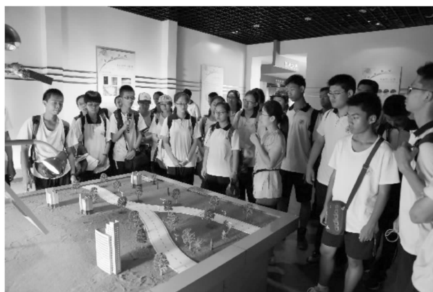
参观科学岛 聆听科学知识