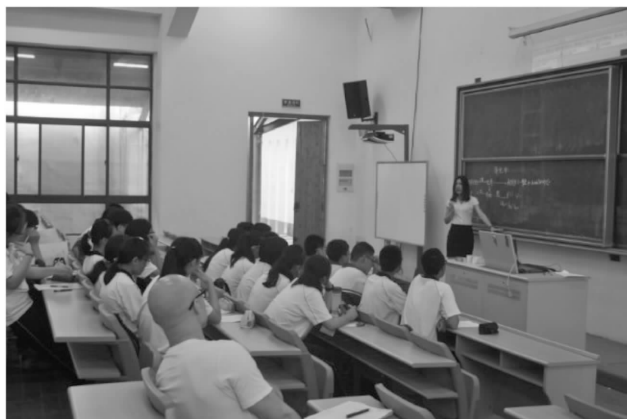
江苏无锡分队同课异构

首先进行的就是大家期待已久的同课异构了。同课异构,就是十二中的师生与南菁中学的师生在同一间教室中上同样的课,三班和九班的同学分别进行了物理、地理和政治学科的学习,课堂上,来自不同学校的老师和同学们亲切的互动,课堂秩序井然,气氛融