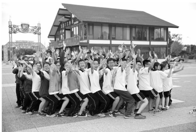
辽宁大连分队同学在参加拓展活动