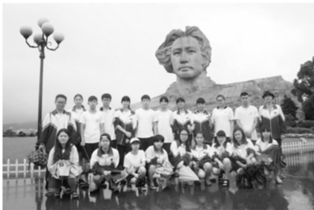
同学们在青年毛主席像下

晚上，我们与九方中学进行了增进友谊的联欢会，两校都是人才辈出，唱歌、跳舞、朗诵……参与表演的同学们让我们看到了与平时教室中不一样的他们。为了这次的联欢会，同学们都倾注了很多心血，