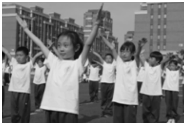
课间操评比进行时

本次评比活动有幸请到部分学生家长代表作为评委出席并观摩,从学生服装、做操质量、入场、退