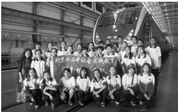
参观株洲电力机车厂“和谐号”

第四、五节课十二中的同学们五人为一组，分别进入高一班级十个班听课。同学们相互学习，友好交流，从对知识的理解、问题的探讨，再到北京湖南两地的节日文化与高考形势。上体育课的同学们还与友校打了一场排球友谊赛。